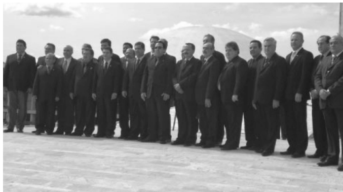
Foto: Presidentes dos Crecis no Congresso Nacional.